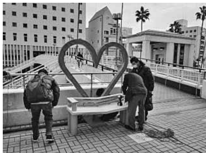
阿南高専の先生方にもお手伝いいただきました