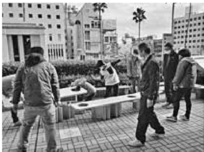
「ひょうたんポケット」組立設営風景

主催：ひょうたん島まちなか再生機構、 徳島県建築士会徳島地域会、 徳島県木材協同組合連合会 協力：徳島都市開発株式会社、徳島市