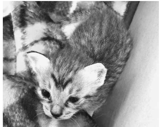
私を猫派に変えた瞬間

皆さんも、コロナ禍でお家時間が増える中、生涯のパートナーとして、育て見守るペットとの楽しい時間を過ごしてみたいかがでしょうか。