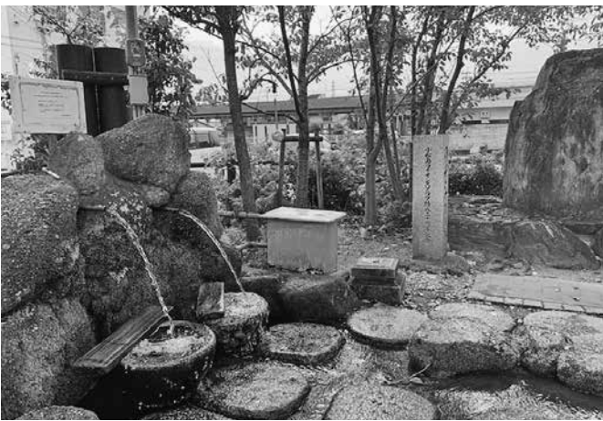
のぞみの泉と、その奥に駅とボットン便所…

そんなhopelessな状況にも、一筋の光明が「のぞみの泉」。言い得たネーミングが絶妙ですが、この水を求めて遠くは香川県からも毎月2t車1杯のポリタンクを持参して来る方もいるとのことで、実際にいつも誰かが並んでいます。