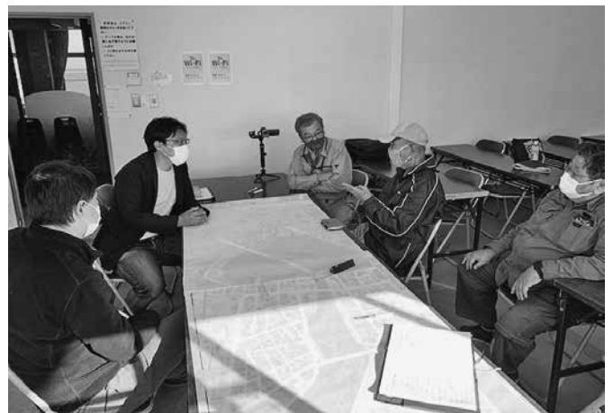
大きな一歩目。地元愛が集結!

とまあ話せば話すほど問題が山積していますが、今年新たに就任された中山市長も一級建築士の士会メンバーなので、今後は良い方向に進むものと確信しています。