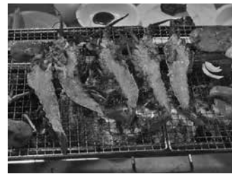
子供たちも、おいし〜(^^)♪