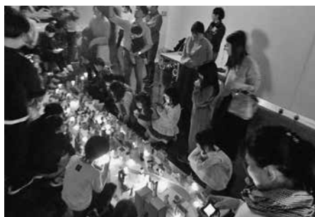
景観ワークショップ