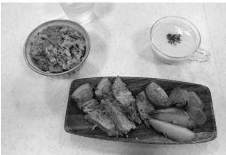
ガス調理器ってイイネ

そして2月8・9日はスキー交流会、雪不足が心配されましたが直前に雪が降り絶好のゲレンデコンディションでした。