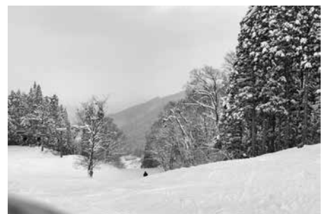
スキー場は雪景色