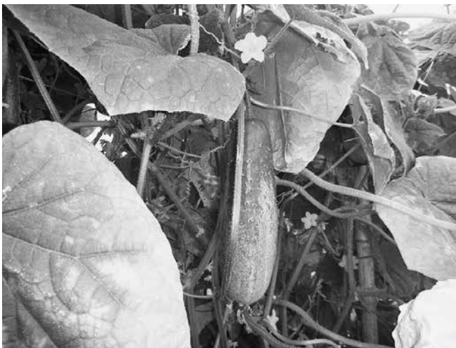
食べごろ太きゅうり

トマト、きゅうり、とうもろこし、パプリカ、枝豆、落花生と等作ってきたが、「野菜は植えておけば実は生る」なんて思っていたが、害虫にカラス、イタチも来る、うどん粉病、青枯病、立ち枯れ病、連作障害、脇芽かき、摘芯等、なかなか難しく、毎年反省である。畑を広げた理由は那賀町の小学校同級生から、「太きゅうり」の種を貰ったのがきっかけである。