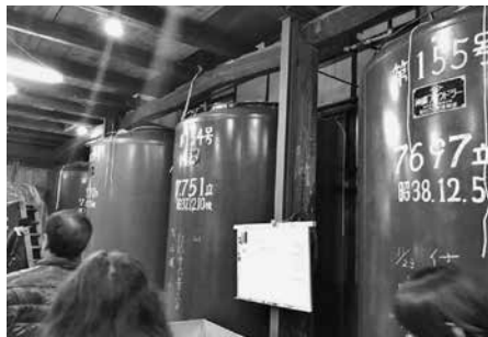
酒蔵ってどんなの？