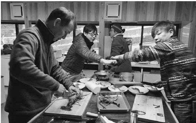
ぶりぶりの身が、とてもおいしそう(´ー´)

調理室では、またまた皆さん慣れた手つきで、大量の海産物を食べやすいように調理してくれてました。今回は、伊勢海老の山!! お刺身や伊勢海老のお味噌汁。