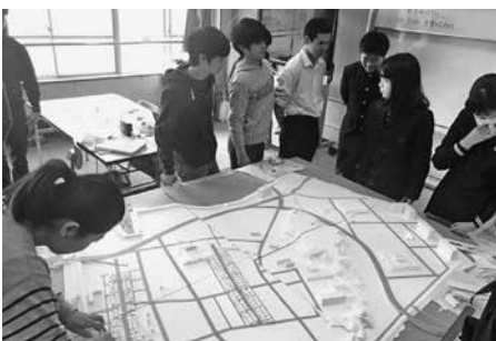
津田の安全確保は万全か