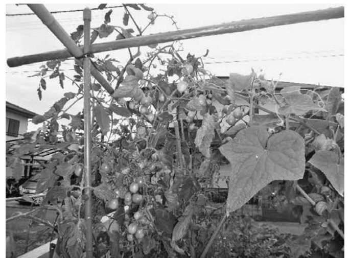
ミニトマトときゅうり

去年また5坪程畑を広げた。連作障害や病気になりやすいと考えたからだ。植える場所を毎年変えようと思ったのだが小さい畑では無理がある。失敗を繰り返しながら、今年も美味しい太きゅうりやいろんな野菜を植えようと考えている。そして貴重な「太きゅうり」の知名度も上げられればと思いながら楽しむつもりだ!!