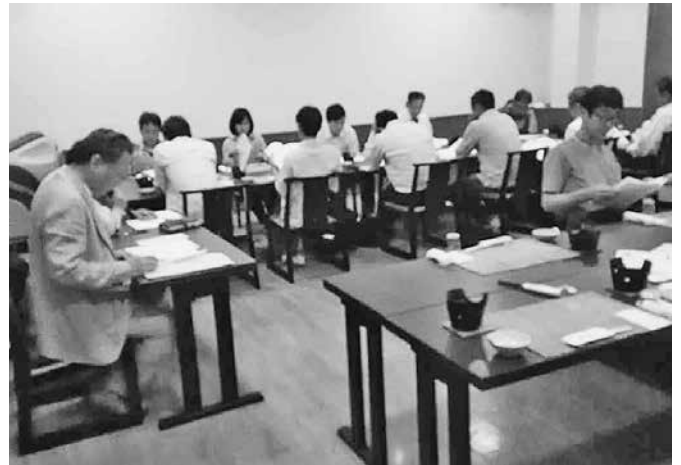
通常総会、親睦会の様子

残った私が家に帰り着いたのが4時過ぎでした。その日夕方までボンコツで家族の視線が冷たかったのは言うまでもありません。