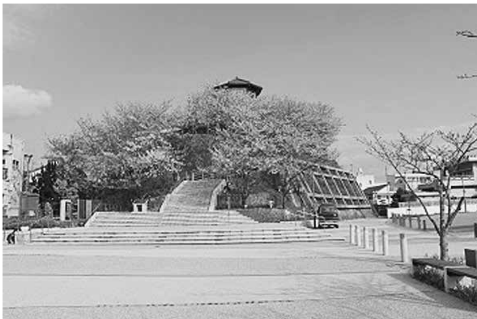
阿南市牛岐城趾公園は士会内でコンペを行った成果です

令和元年 新たな気持ちで士会に自分なりの協力ができればと思います。建築仲間として!!