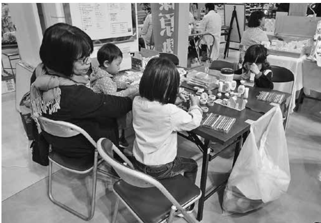
どんなおうちができるかな ( ^_- ) ☆

いろんな形の木を2つ選んで100角程度の敷地の上にかいさなおうちを作ります。きれいな模様が入った紙やかわいいマスキングテープ、シール、モール等、子供たちが大好きな材料がいっぱい!それを手に取っただけで夢が膨らみます。みんな夢中になって製作に取り組んでました。